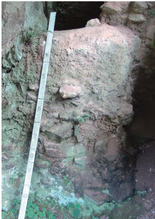
14 現在の保存地区土層断面（2005年8月、遠部慎撮影）