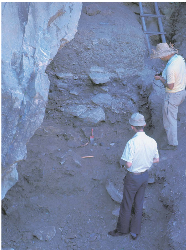
10 第4次BC保存区土層断面（北西から、1969年8月）