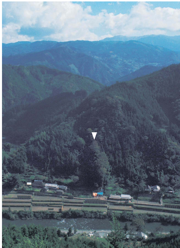
3 第4次調査遺跡遠景（北西から、1969年8月） ▽ 遺跡の位置