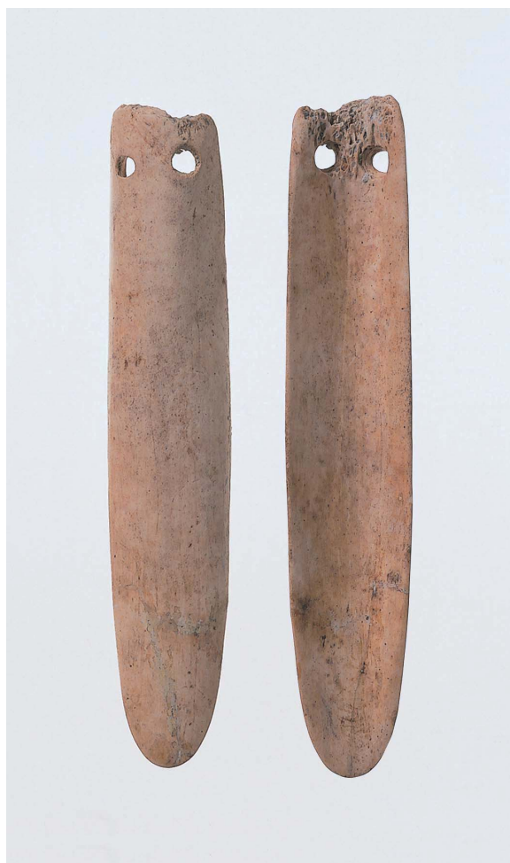
25 ヘラ状骨器 (長さ 9.8 cm) (23, 25 勝田撮影)