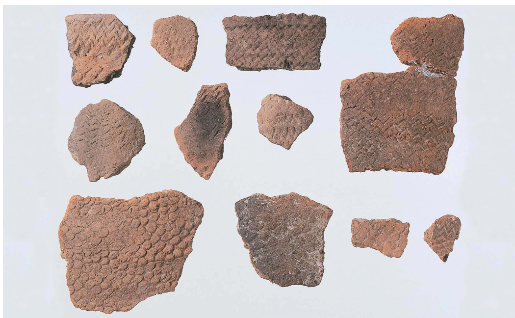
17 3 群土器