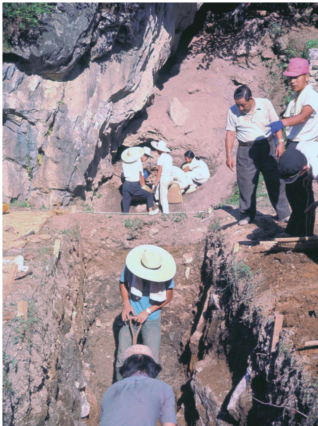
13 第4次F区発掘調査風景（1969年8月）