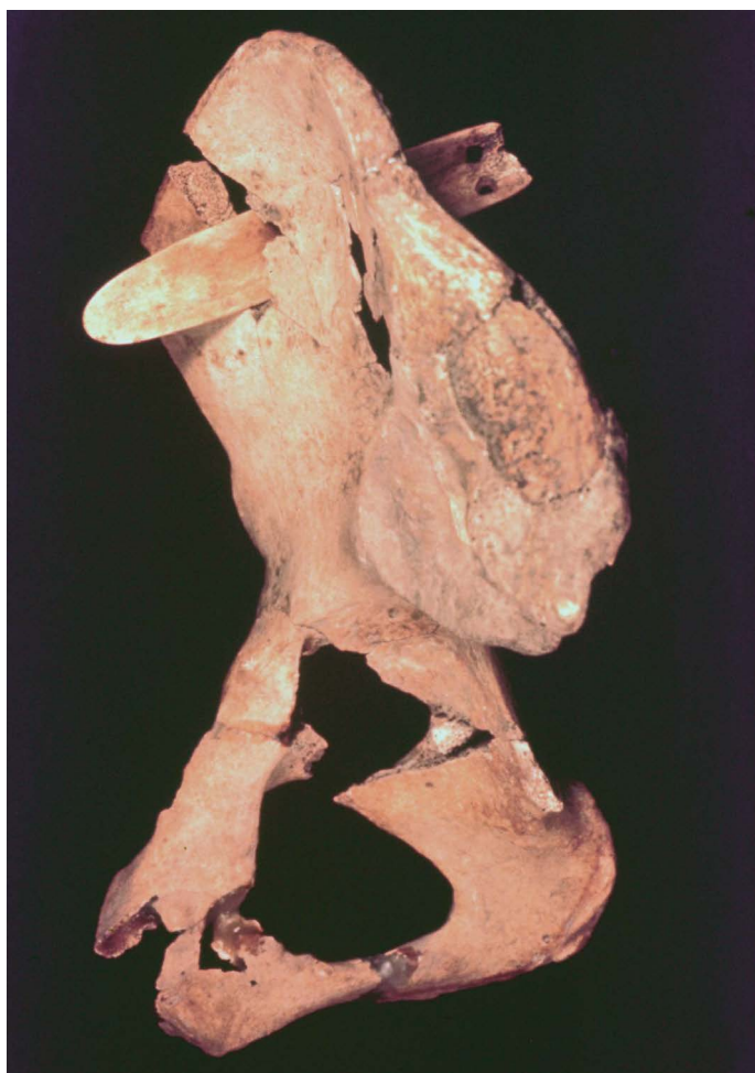
24 ヘラ状骨器が刺さった女性の右寛骨