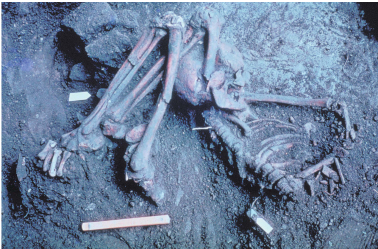
9 第1次調査時の縄文早期人骨の出土状況（1961年10月）