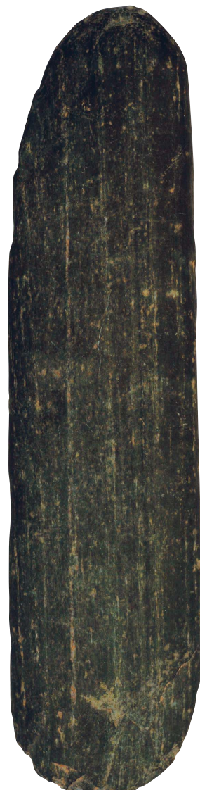
22 棒状線刻礫 (長さ 25.1 cm)