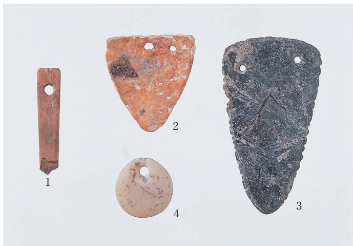
1 鹿角, 2 二枚貝, 3 結晶片岩, 4 石英