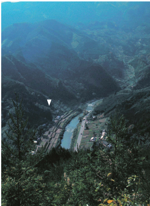
2 第4次調査遺跡遠景（北から、1969年8月） ▽ 遺跡の位置