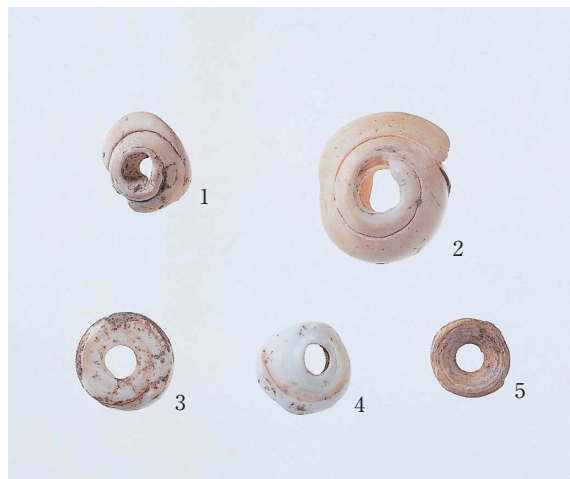
1～4 マガキガイ, 5 サメ脊椎骨