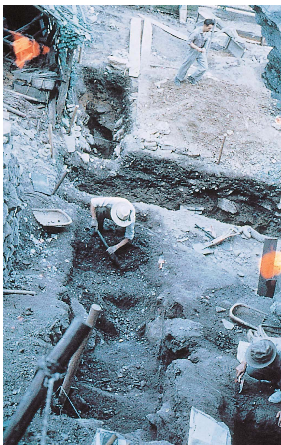
8 第2次調査風景（南東から）