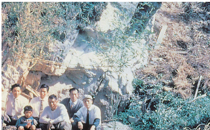
6 第1次調査前の岩陰（北西から、1961年10月）