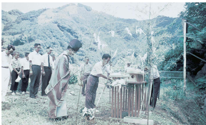
7 第2次調査開始神事（1962年7月）