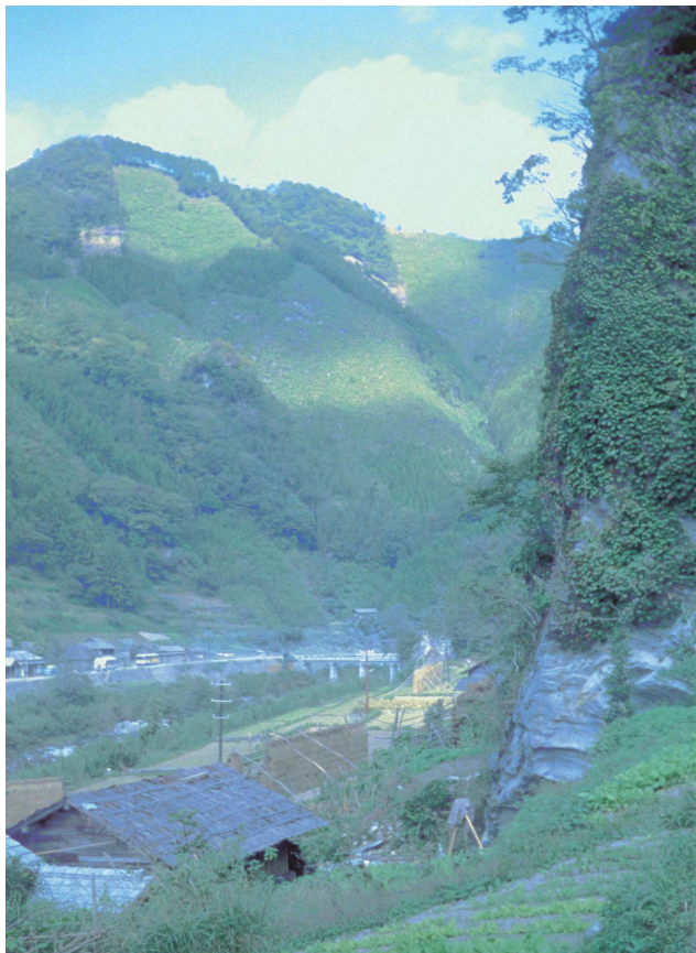
4 第3次調査遺跡遠景（南から、1962年10月）