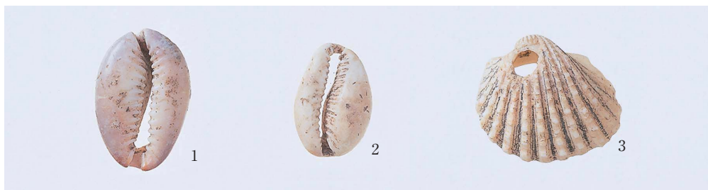
23 出土装身具 1・2 タカラガイ, 3 ハイガイ