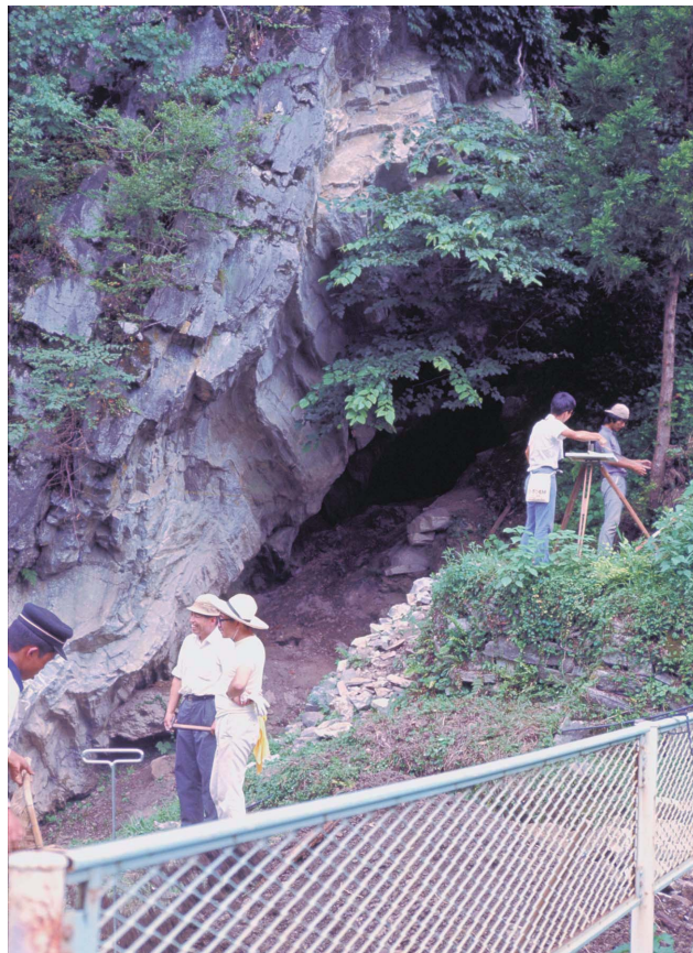
5 第4次調査岩陰入口付近（西から、1969年8月）