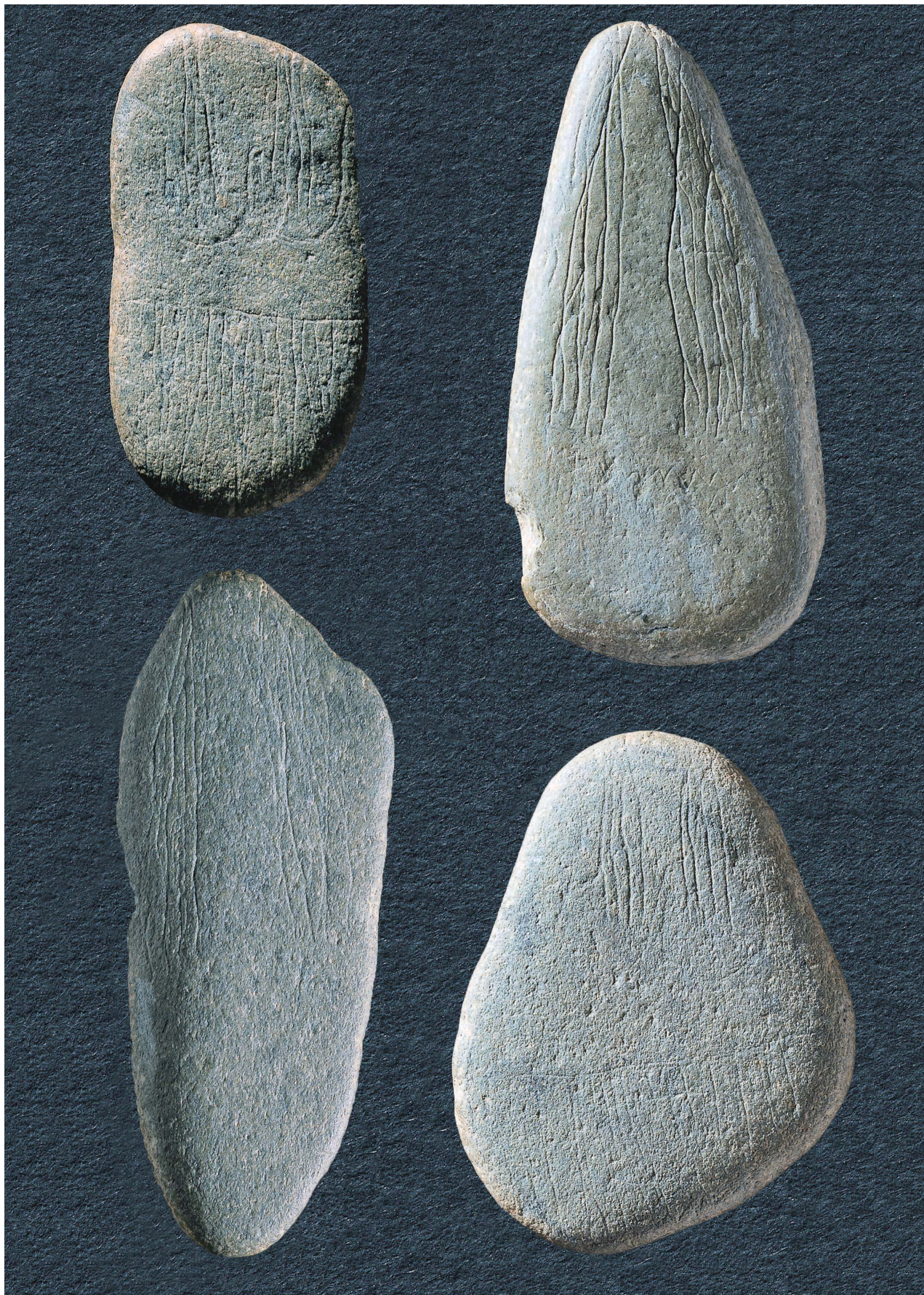
15 出土石偶 (×2.0)