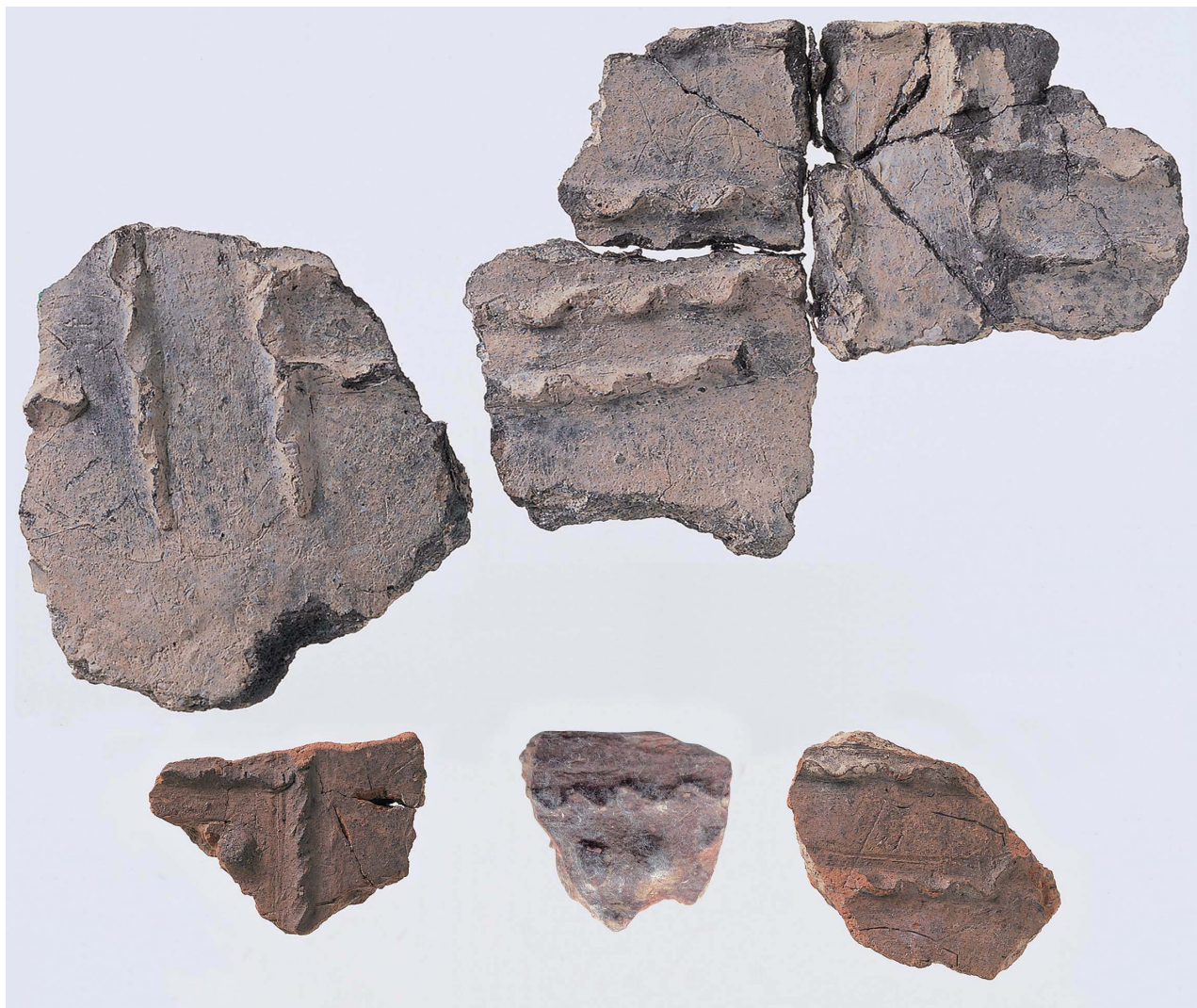
16 1 群土器