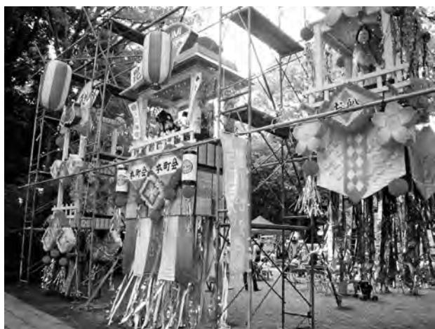
写真2 野田七夕まつり (2009)

色鮮やかな竹飾りを飾る七夕まつりは、戦後に盛んになり、高度成長期前半に各地で盛大に行われた都市祭礼である。しかし民俗学における七夕研究は、ほとんどが七夕の起源に注目し、都市で盛大に行われた七夕まつりを視野の外に置いてきた。祭礼研究の分野では、「神」とのかかわりが見られな