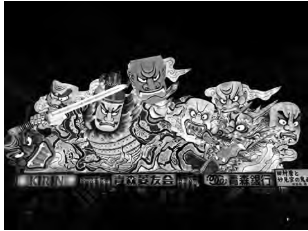
写真1 青森ねぶた祭 竹浪比呂央作「田村磨と妙見宮の鬼面」青森菱友会（2011）

このような祭礼の形態が成立したのは高度成長期のことである。本章では、戦後から高度成長期の変化を記述し、現在の形態が成立するまでの様相をまとめてみたい。