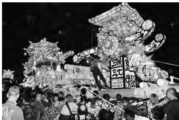
写真3 となみ夜高まつり(深江村新栄町, 2015)

これらの祭礼は、福野神明社の祭礼として行われる福野を別にすれば、特定社寺の宗教行事ではなく、農村で田植え後の休み