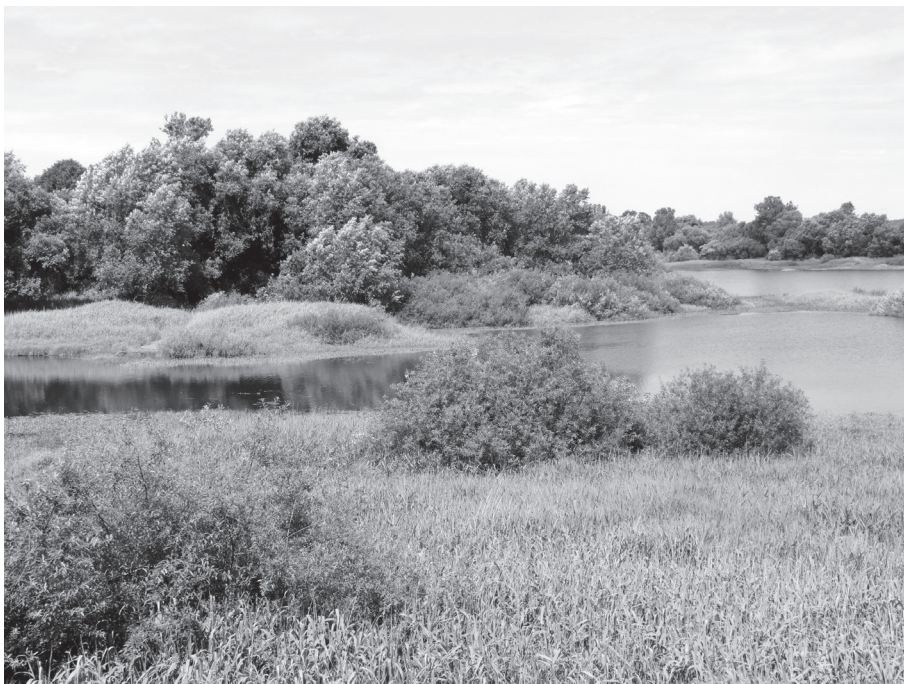
写真1 砂沢遺跡遠景

なおこの調査に関しては、「最北端の水田稲作」（『本郷』No.96, 23-25頁, 2011.11）に小文を寄稿している。