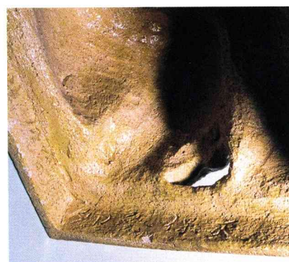
35 (37-027) 黄釉寿老人形香炉 (讃窯) 天保14年(1843) 東京国立博物館