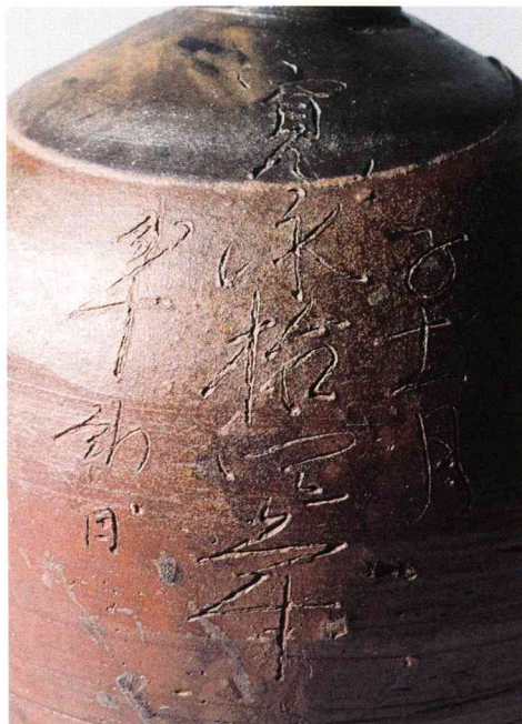
33 蕪形德利 (備前) 寛永14年(1637) 国立歴史民俗博物館