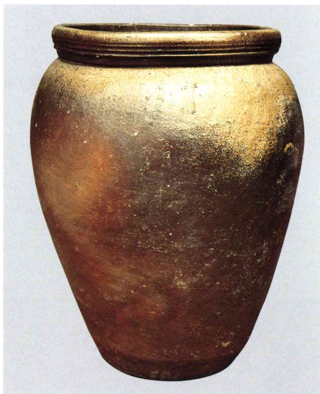
28 (33-037) 大甕 (備前) 慶長2年(1597) 国立歴史民俗博物館