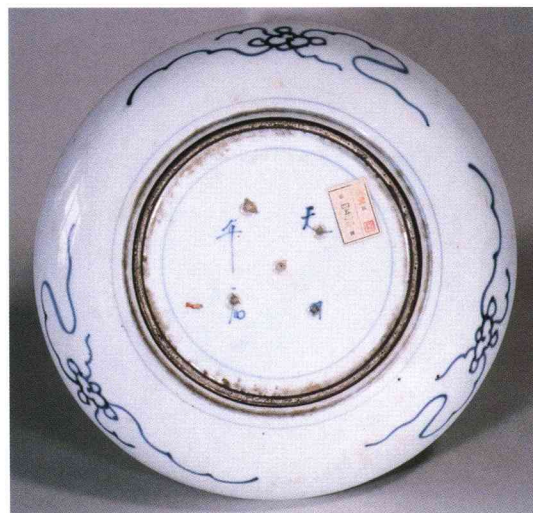
47 (41-101) 染付牡丹獅子図大皿 (有田) 天明(1781~89) 東京国立博物館