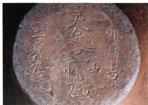
29 (33-013) 四耳壺 (備前) 天文2年(1533) 東京国立博物館