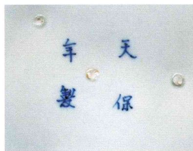
46 (41-203) 染付金毘羅帆船図皿 (有田) 天保(1830~44) 国立歴史民俗博物館