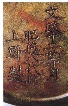
52 (43-045) 象嵌曆手文壺 (平山) 文政12年 (1829) 佐賀県立九州陶磁文化館