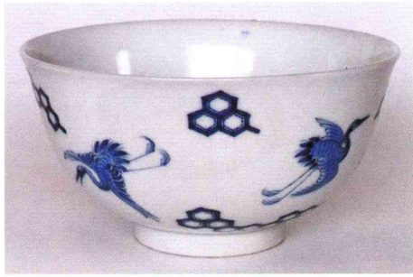
◀49 (42-007) 染付鶴亀 甲文碗 (平戸) 天明 (1781~89) 国立歴史民俗博物館