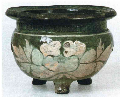
51 (43-006) 象嵌牡丹寿字文香炉 (平山) 享保19年 (1734) 熊本・勝明寺