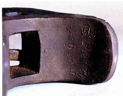
31 (33-084) 彩色馬形香炉 (備前) 貞享4年(1687) 東京国立博物館