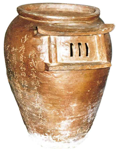
53 (47-002) 骨壺 (厨子甕) (沖縄) 隆武6年 (1650) 個人