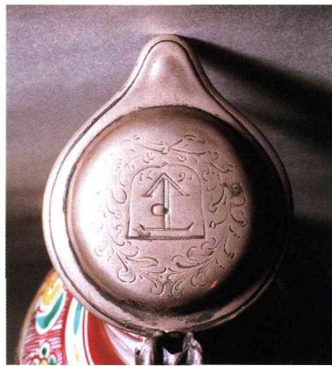
◀38 (41-参10) 色絵雲文水注 (有田) 寛文11年(1671) 東京国立博物館