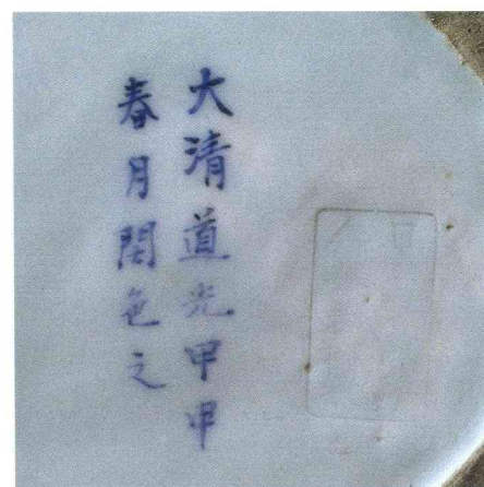
48 (42-020) 染付山水文水指 (亀山) 文政 7 年(1824) 国立歴史民俗博物館