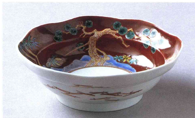
45 (41-参31) 色絵松竹梅文輪花鉢 (有田) 享保14年 (1729) 国立歴史民俗博物館