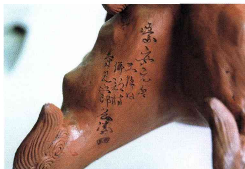
32 (33-072) 毬取獅子置物 (備前) 慶安元年(1648) 国立歴史民俗博物館