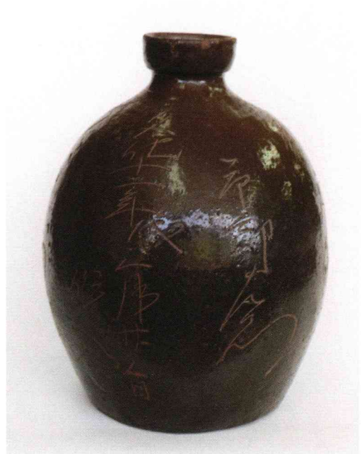
50 (46-011) 鉄釉字入徳利 (苗代川) 文化12年 (1815) 国立歴史民俗博物館