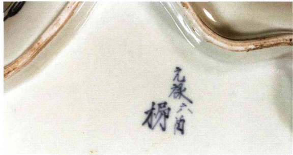
37 (41-051) 色絵金彩松に帆掛舟図変形皿 (有田) 元禄 6 年(1693) 東京国立博物館 (寄託)