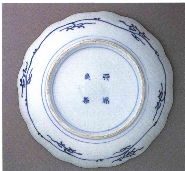
41 (41-207) 色絵丸文輪花皿 (有田) 天保(1830~44) 国立歴史民俗博物館