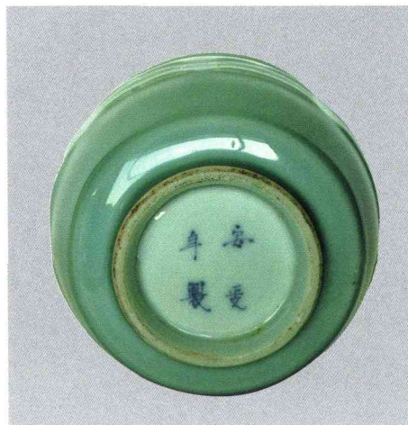
42 (41-246) 青磁算木文火入 (有田) 安政(1854~60) 国立歴史民俗博物館