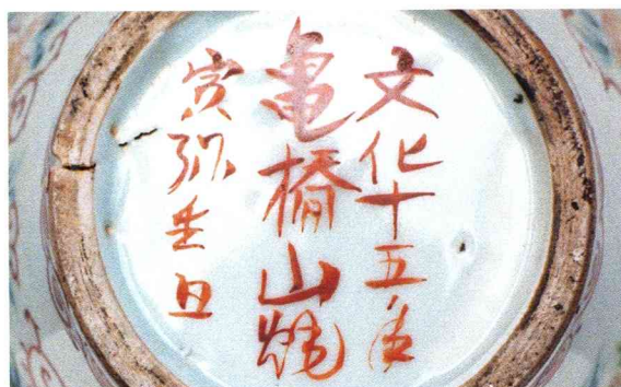
34 (38-005) 色絵牡丹文蓋付茶壺 (砥部) 文化15年(1818) 個人