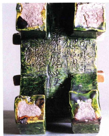
36 (37-002) 三彩三春駒形香炉 (源内) 安永3年(1774) 東京国立博物館 (寄託)