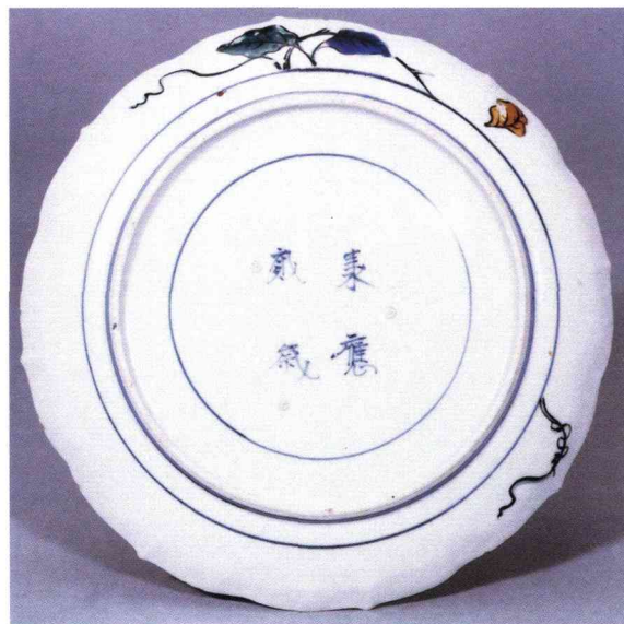
40 (41-024) 色絵柘榴松竹梅文輪花皿 (有田) 承応2年(1653) 出光美術館